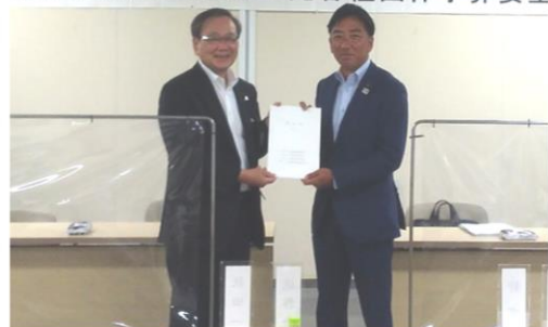
左:児玉会長 右:東京都議会自由民主党 山崎一輝 幹事長