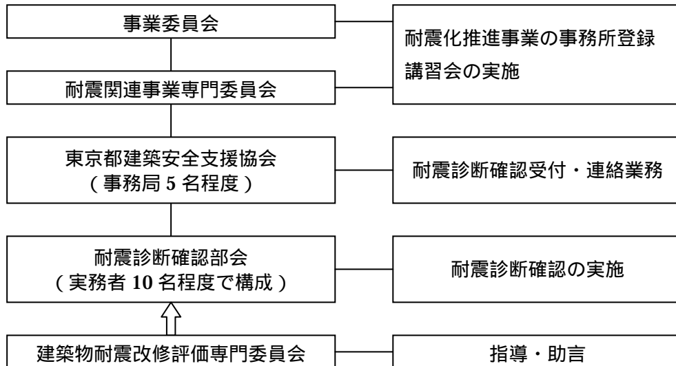
図-1 耐震診断確認の実施体制